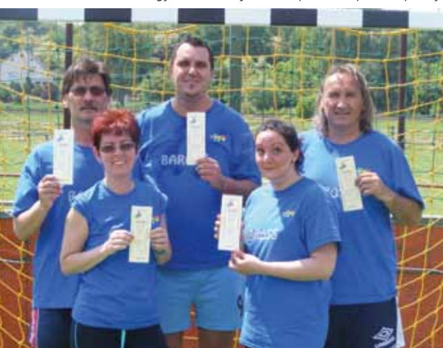
A Baross iskola győztes tanári futballcsapata, középen a kapitány

színvonalú, így találtak rá a Hernád utcaiakra. Szerették volna, hogy a gyerekek kiléphessenek a megszokott térségi környezetből. Akkor egy betlehemes játékot mutattak be az erzsébetvárosiaknak, ezt egy partizánlabda mérkőzés követte, amit a Baross nyert meg. Most is összecsapott a két iskola a gyönyörű műfüves pályán, a gyerekek az első pillanattól óriási energiával biztatták csapataikat, hangozott tőlük a határ. A lányok kézilabda-mérkőzését izgalmas hosszabbítás után a galgagyörkiek 14–12-re nyerték, a fiúk futballviadalát szoros küzdelemben szintén a györkiek nyerték 4–3-ra. Szépitíteni csak a Baross tanári csapata tudott, akik 4–2-re verték a hazai tanári kart fociban. A budapesti látogatás eredményét is beszámítva tehát jelenleg az összesítésben döntetlen az állás. A Baross iskola igazgatója, Spiess Ádám szerint azért is hasznosak ezek a látogatások, mert a Belső-Erzsébetvárosban élő gyermekek többségének nincs semmilyen tapasztalata a vidéki életről.