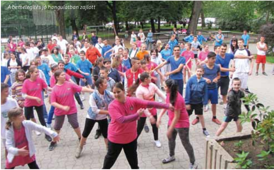
A bemelegítés jó hangulatban zajlott