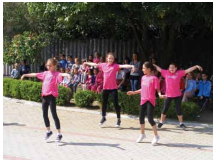
A Baross sulis aerobik-bemutatója