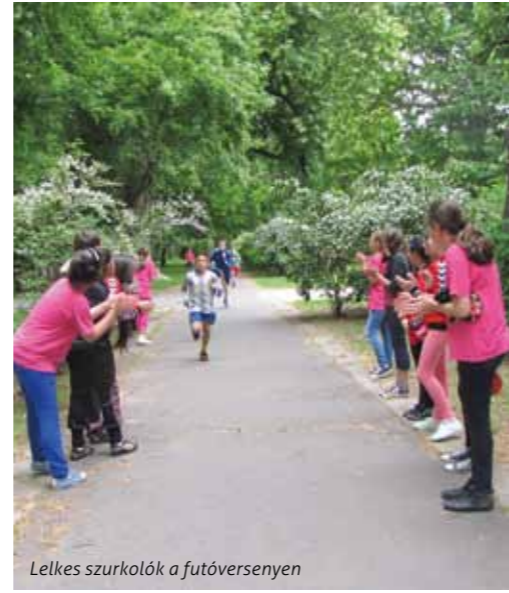
Lelkes szurkolók a futóversenyen