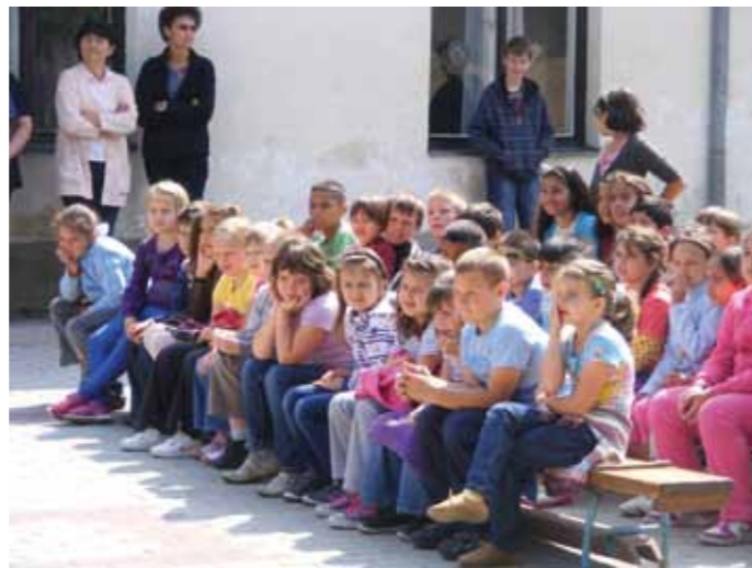
A lakodalmas nézői az iskola udvarán