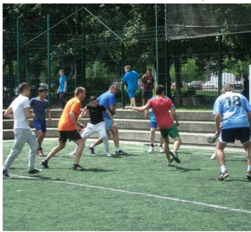
„történelmi” tanár-diák focimeccs

Délután a napközis tanulók sor- és váltóversenyen vettek részt, emellett ők is asztaliteniszezhettek, kidobózhattak és partizánlabdázhattak.